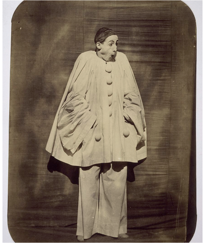
Adrien Tournachon, Pierrot surpris , 1854