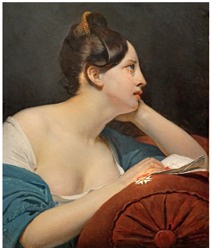
Claude-Marie Dubufe, Lettre de Wagram , 1872