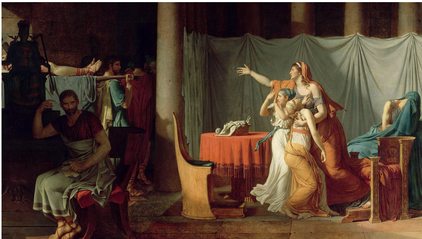
Jacques-Louis David, Les licteurs rapportent à Brutus les corps de ses fils , 1789