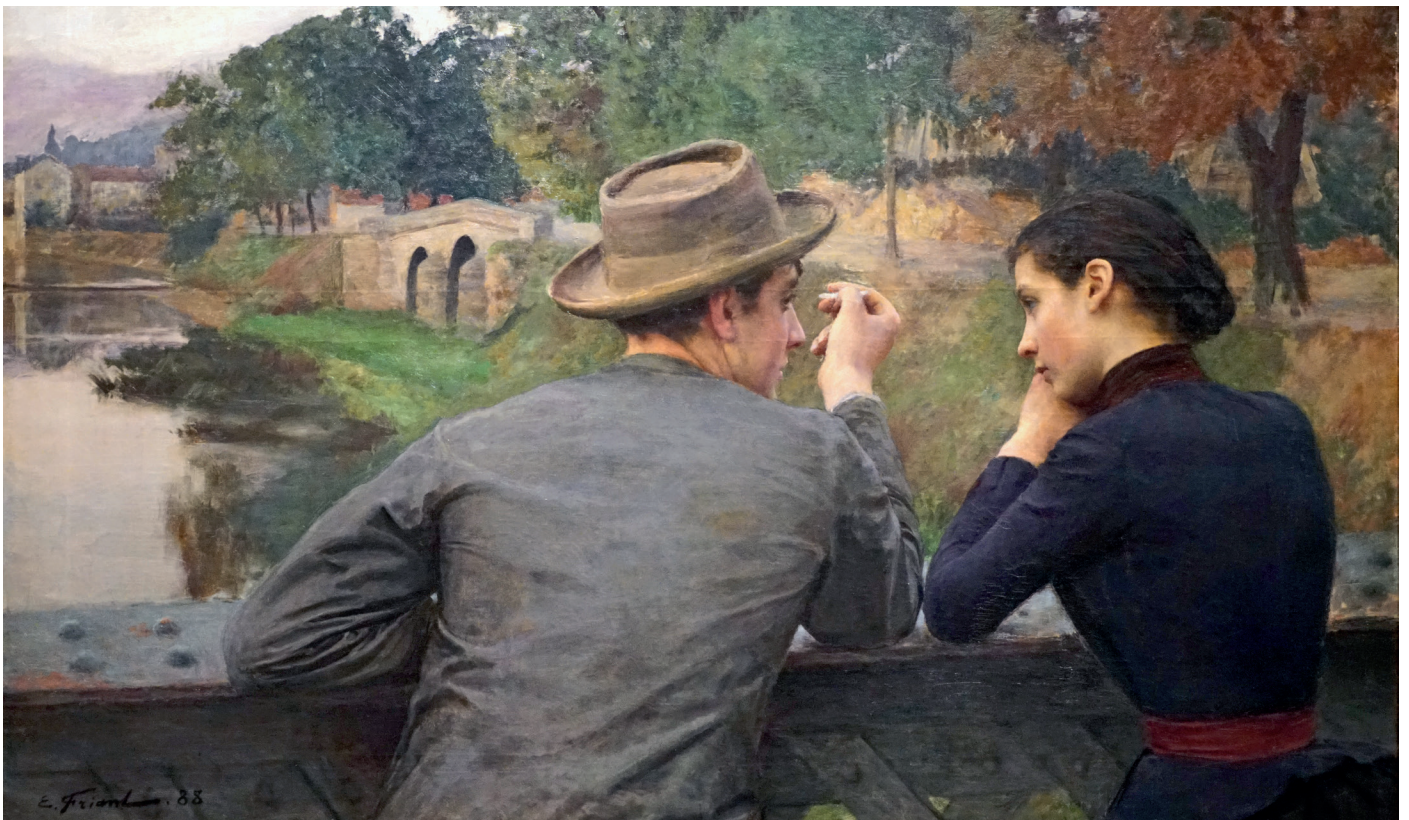
Émile Friant, Les Amoureux , 1888