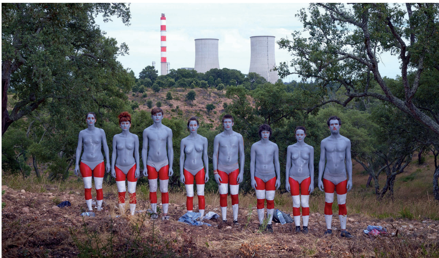
Olaf Breuning, Protesters , 2014