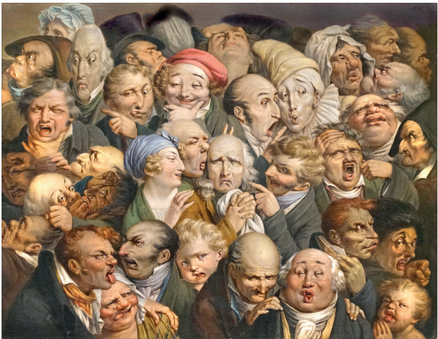
Louis Léopold Boilly (1761-1845). Trente-cinq têtes d'expression , vers 1825