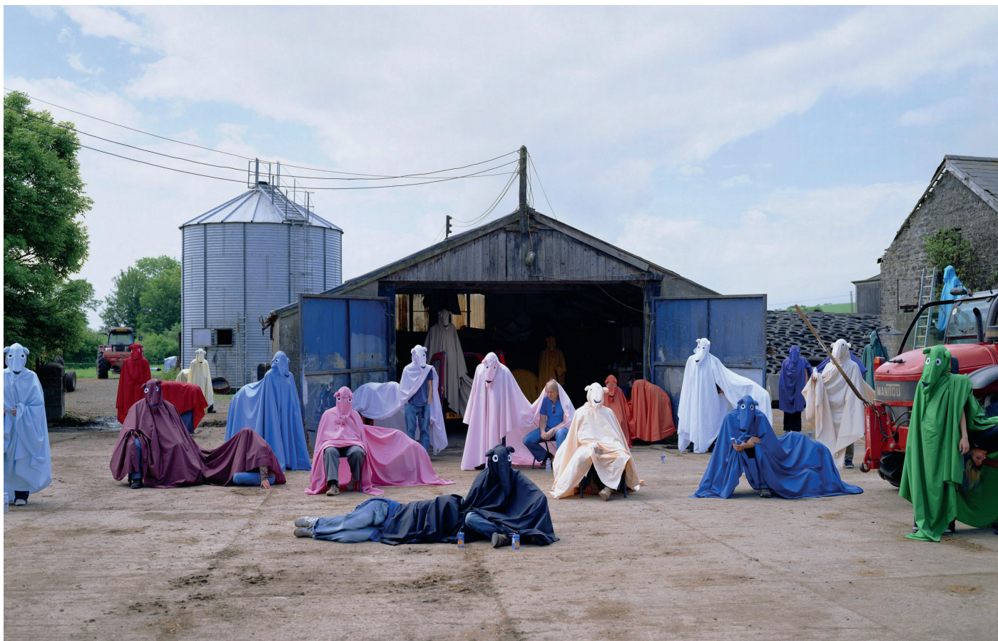
Olaf Breuning, Horse-farm , 2004