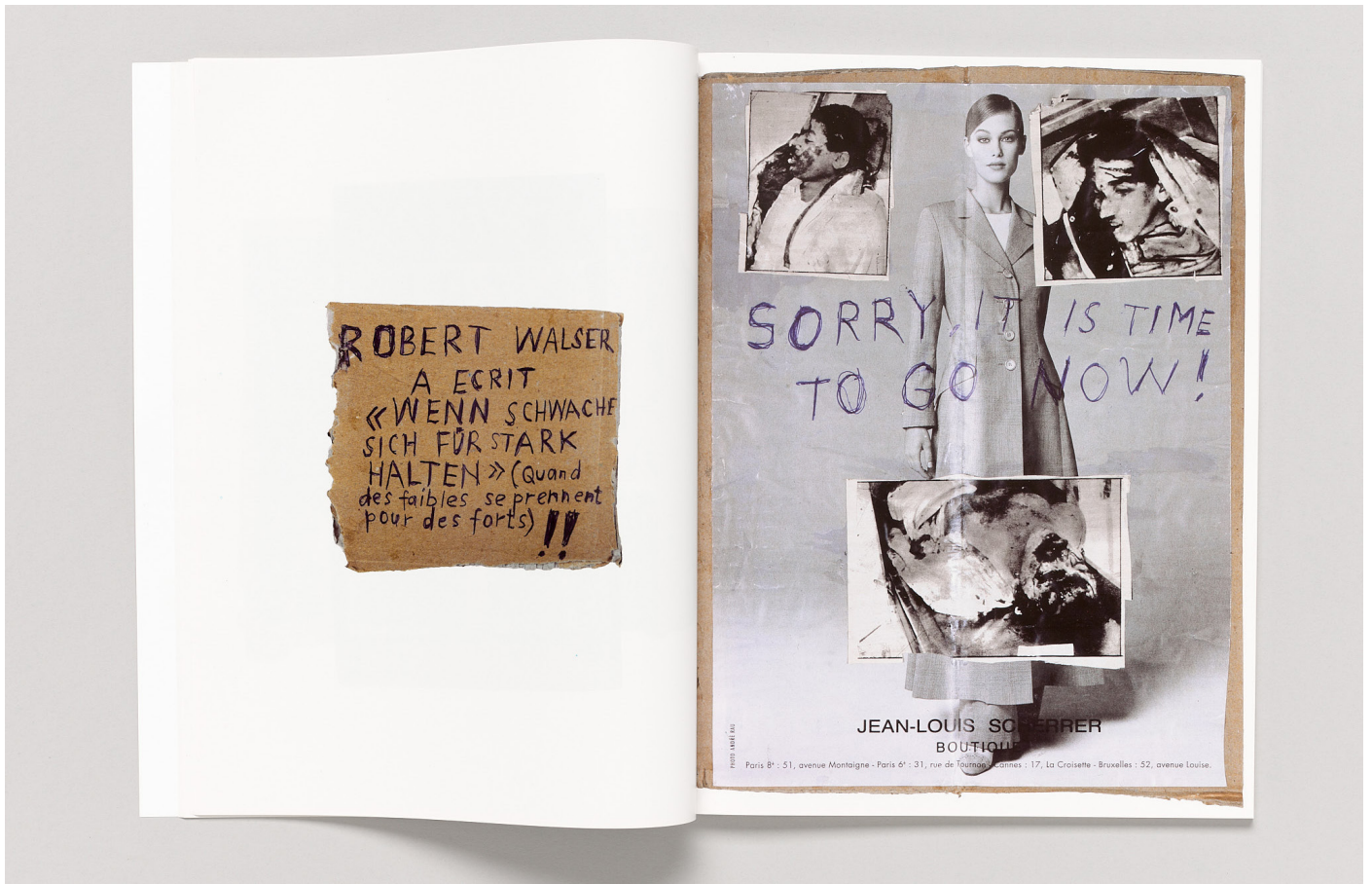
Thomas Hirschhorn, Les plaintifs, les bêtes, les politiques