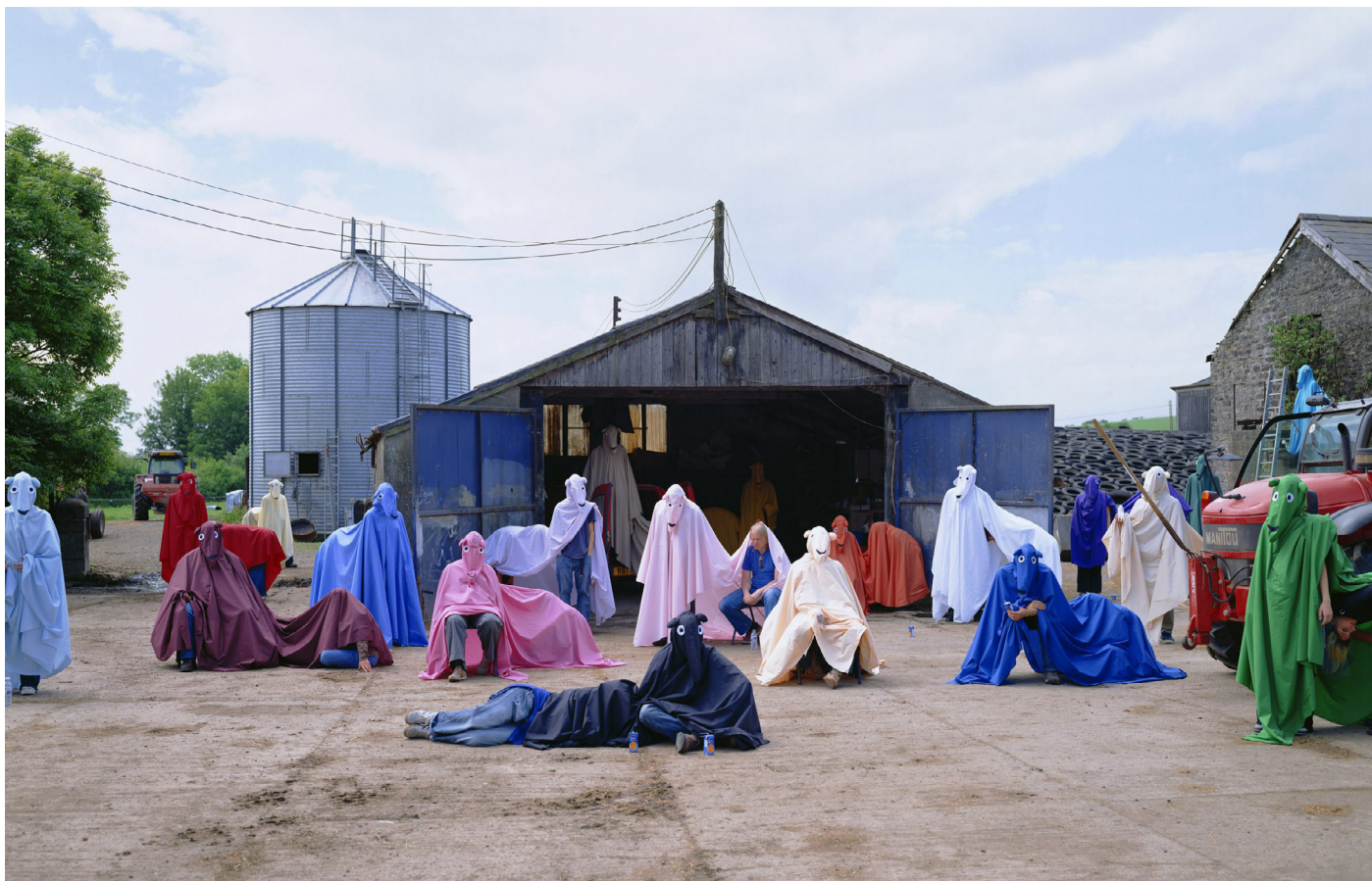
Olaf Breuning, Horse-farm , 2004