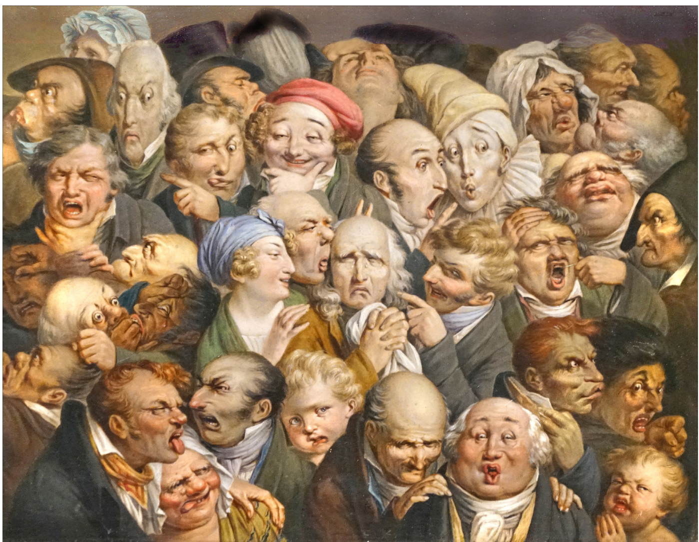
Louis Léopold Boilly (1761-1845). Trente-cinq têtes d'expression , vers 1825